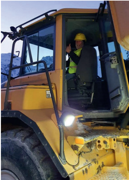
Unser Chauffeur auf Abwegen

nahe Deponie „Las Piazzettas“. Dort erfuhren wir, dass der grösste Teil des ausgebrochenen Materials zu Rohstoff für die Betonproduktion, als Sickerkies und zu Strassenkoffer und zu Bahnschotter aufbereitet wird.