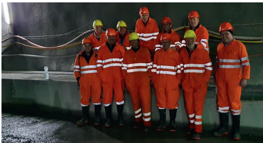
Truppe Männerriege Samedan bei Querverbindung 4

Die bereits ausgebrochenen Verbindungsgänge (QV 1-12) zwischen altem und neuem Eisenbahntunnel sind mit provisorischen Türen abgeschlossen. Wir öffneten eine solche Tür und befriedigten unseren „Gwunder“ und sahen, auf der Seite Spinass, die drei Lampen eines in den Tunnel einfahrenden Zuges. Die Geschwindigkeit, mit welcher dieser Zug bei unserer Tür war, haben wir unterschätzt. So brauchte es drei Turner um die Tür gegen den Luftdruck des Zuges zu schliessen. Infolge dieses Luftzuges flogen den restlichen Männerriegler Kessel und diverse Plastikteile um die Ohren und dies bis die Tür wieder verschlossen war. Nachdem wir uns wieder aus dem Overall befreit haben, gab es im nahen Hotel Kulm einen kleinen Aperitif. Frisch gestärkt besuchten wir, zu Fuss, noch die