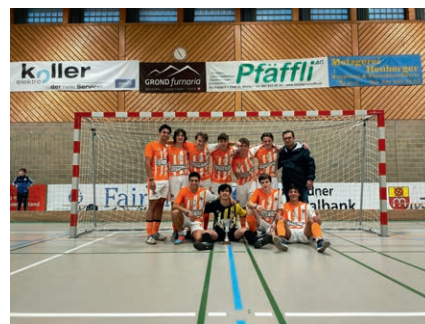
Sieger der Kategorie Aktiv „Vitamina“

Am Wochenende vom 20./21. November fand das traditionelle Hallenfussballturnier des FC Celerina in der Mehrzweckhalle Promulins in Samedan statt. Während zwei Tagen haben 31 Teams über 90 Spiele ausgetragen, aufgeteilt in den Kategorien „Lizenzierte“, „Hobby“ und „Damen“. In der Kategorie „Hobby“ gewann das Team von Real Cugnasco aus dem Tessin. Im sehr engen Finalspiel gewannen sie gegen die andere Tessiner Mannschaft «Amiis dall'Engadina» mit 2:1. Damit holte Real Cugnasco sein zweiter Turniersieg nach 2017.