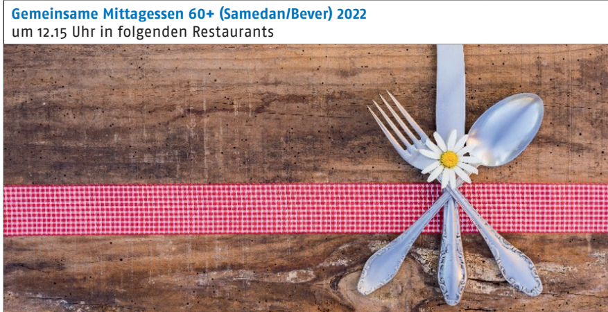
Gemeinsame Mittagessen 60+ (Samedan/Bever) 2022 um 12.15 Uhr in folgenden Restaurants