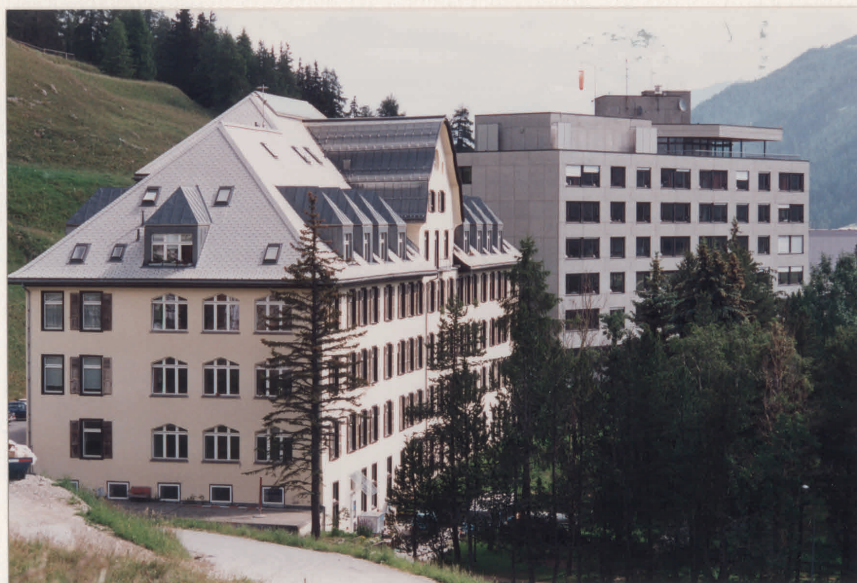
Foto von 1995: Das ehemals "neue" Spital ist nun zum "alten" geworden. Seit 1979 steht das jetzige "neue" daneben. Entgegen der ursprünglichen Absicht, das alte Gebäude abzureissen, wurde es restauriert und innerlich für neue Aufgaben umgebaut. Zahlreiche Wohnungen, Büroräumlichkeiten und Praxisräume sind in diesem Haus entstanden, während im Tiefparterre eine "Geschützte Werkstätte Engadin und Südtäler" mit hellen und auch freundlichen Arbeitsräumen für behinderte Erwachsene eingerichtet werden konnten.

Das 1914 eröffnete "zweite" Kreisspital Oberengadin. Dahinter (etwas verdeckt) das später dazugekommene Absonderungshaus. Rechts das alte Spital. Die letzteren beiden Gebäude mussten 1973 abgebrochen werden, da sie einem neuen "dritten" Spital Oberengadin mit moderneren Einrichtungen Platz schaffen mussten.