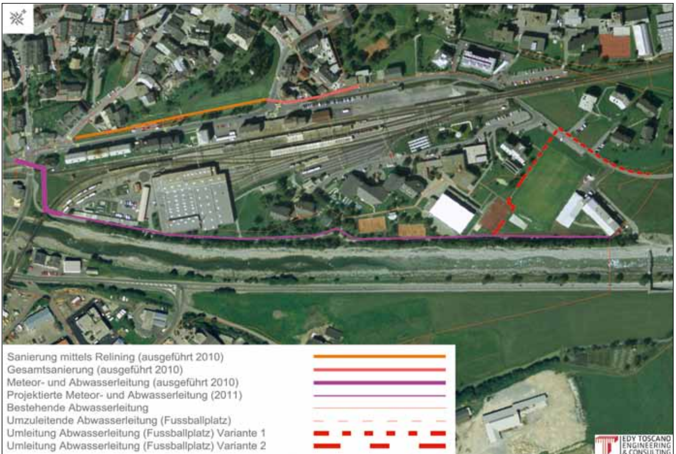
Projektperimeter Sanierung Infrastruktur Via Retica und Meteorleitung Suot Staziun

Der Kanton Graubünden realisiert im Zuge des Ersatzes der Brücke bei Punt Muragl auch einen neuen Kreisell. Dieser wird in Beton ausgeführt. Da unter dem Kreisell die Druckleitung Val Roseg hindurchführt, musste die Gemeinde vom Kanton verlangen, dass sichergestellt wird, dass der Unterhalt dieser Leitung auch unter der Betondecke möglich ist. Für die entsprechenden Mehraufwendungen muss die Gemeinde dem Kanton CHF 45'000 bezahlen.