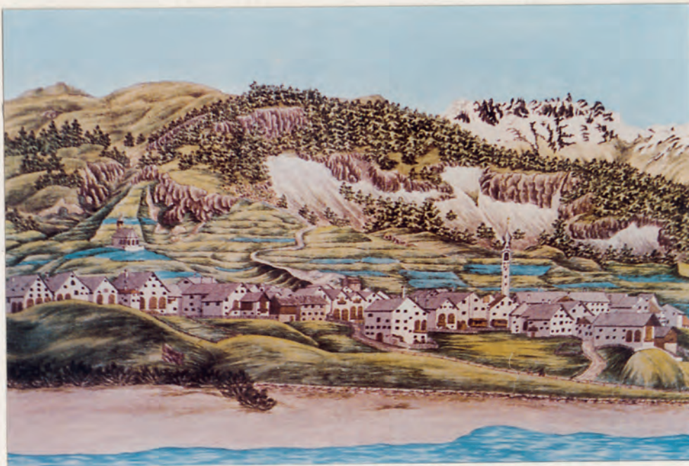
Samedan anfangs des 19. Jahr- hunderts. Eine der ältesten Darstellungen des Dorfes. Maler unbekannt.