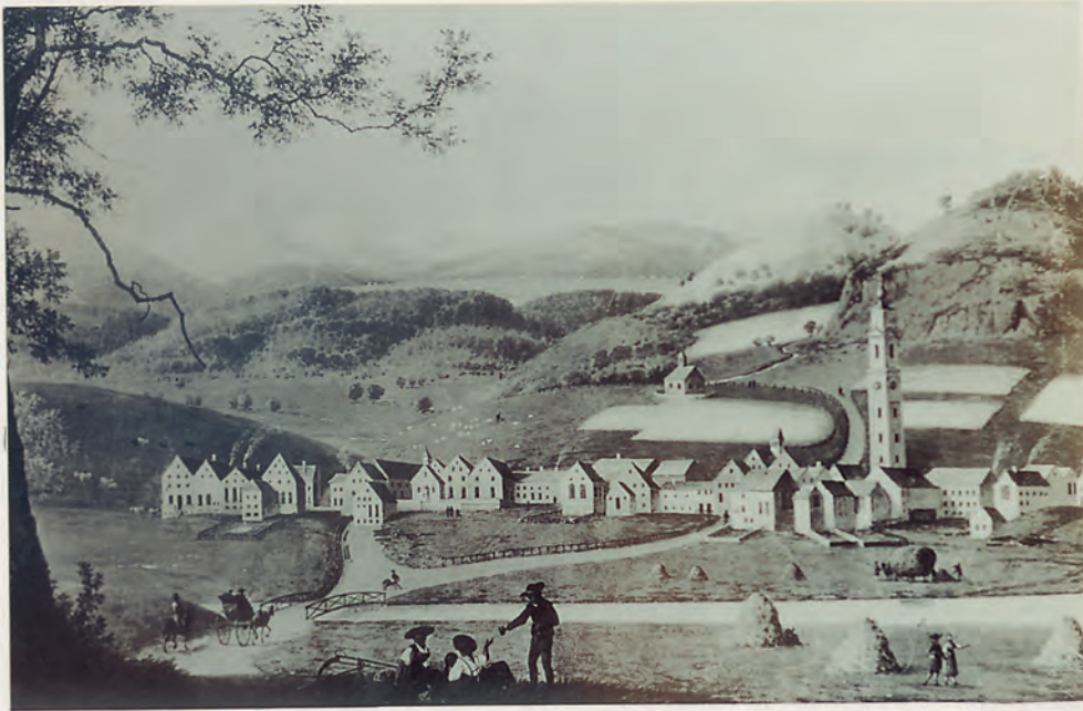
Samedan um das Jahr 1840. Ausschnitt aus Dorfansicht von E.E.Schaffner.