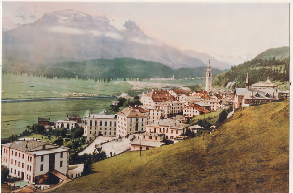
Samedan von Osten um 1900. Sichtbare Entwicklung!