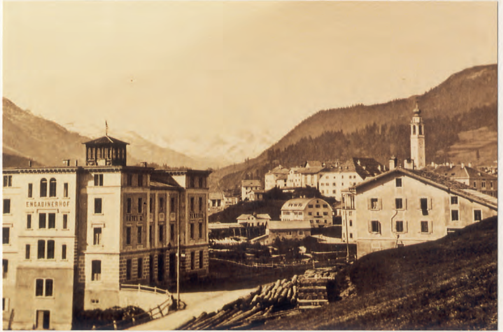
Samedan um 1870 von Osten gesehen. Links das damalige Hotel Engadinerhof. Ab 1888 die bekannte Engadiner Bank. Seit 1943 Mittelschule und ab 1990 Tourismusfachschule.