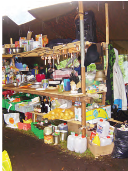
Blick in die Lagerküche vom Cevi-Sommerlager 2014