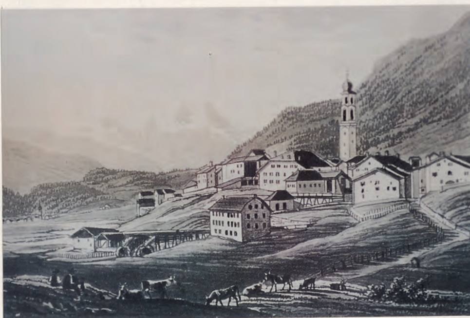
Samedan um 1840, nach einem Stich von J.J.Meyer. Zu beachten ist das Aquadukt, das das Wasser des Dorfbaches zu den verschiedenen Mühlen, Sägereien und anderen gewerblichen Betrieben führte.