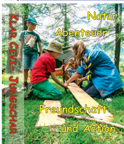
Die CEVI-Jungschar ist eine konfessionsübergreifende Kinder- und Jugendarbeit im Oberengadin www.cevi-samedan.ch