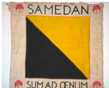
Fähnlein Landi 39

Tapezierergeschäft von der Ladentochter Emilia Kreis die gewünschten beiden Fähnlein herstellen. Das eine hat die Gemeinde der Pfadfinderabteilung, die im Jahr vor der Eröffnung der Landi gegründet worden ist, überlassen, das andere ist erhalten im Schweizerischen Nationalmuseum in Zürich. Das Zentrum des Fähnleins zeigt das rechts quergeteilte Feld in Gelb und in Schwarz, das offensichtlich dem damaligen Gebrauch entsprach.