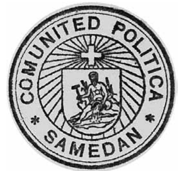
Stempel Antwort Wappenkommission

mit dem Gemeinds-, und in dessen Abgang mit dem Gerichts- oder Hochgerichtssiegel versehen seyen.“ Sie wurden aufgefordert, „Siegel innert Jahresfrist anzuschaffen“, wobei „die Form der Siegel ... den Gemeinden überlassen werde, auf allen aber der Name der Gemeinde zu erscheinen habe“. Und 1869 wurde aus Bern die Anregung gemacht, die Sammlung der authentischen Kantonswappen für den Ständeratssaal durch „die Wappen der Städte, der bedeutenden geschichtlich merkwürdigen Landschaften und Bezirkshauptorte“ zu ergänzen. Damals wurden die Wappen, die sich im Wappenbuch des Rudolf Amstein zu Malans befanden, nach Bern übermittelt; Samedan war nicht darunter. Die genannte Wappenkommission schickte am 20. April 1945 an alle Gemeinden einen Fragebogen, der aus Samedan schon am folgenden Tag zurückgeschickt wurde und einige bemerkenswerte Antworten enthält. Ein „Gemeinde-Wappen existiert seit mehr als 100 Jahren“ steht als Antwort auf die Frage, ob je über ein Wappen Beschluss gefasst worden sei. Bei der Aufforderung, ältere und neuere Stempel abzudrucken, erscheint der gleiche Stempel in dreifacher Ausführung mit der Schrift „Grundbuchamt Samedan Kanton Graubünden“, „Comunita politica Samedan“ und „Vorstand der Gemeinde Samedan“.