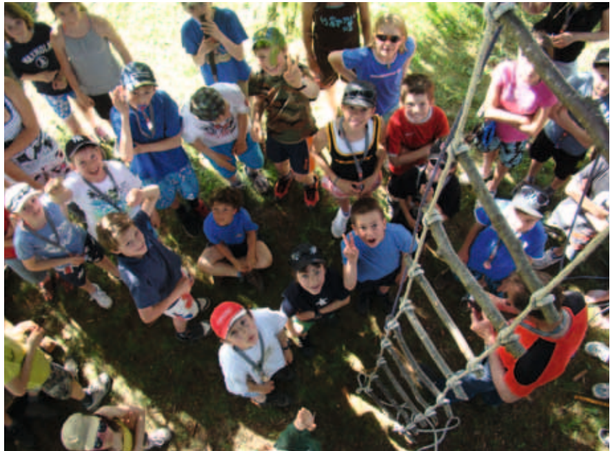
Spiel und Spass im Kinderlager

Nächster Termin: Samstag, 23. Februar 2013 von 14 bis 17 Uhr im evang. Kirchgemeindehaus.