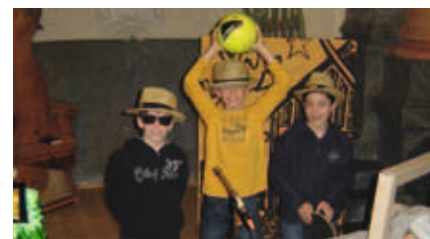
Bei der Probe des Weihnachtsspiels

Die Kirche war fast bis auf den letzten Platz gefüllt und die Freude der Kinder am Spiel war augenfällig. Aber nicht nur sie freuten sich, sondern natürlich auch die anwesenden Eltern, Grosseltern, Nach- barn usw. Das Lied „Lo quella staila...“ bildete einen feierlichen Abschluss des eindrücklichen und gelungenen Weih- nachtsspiels. Allen Beteiligten, die zur Bös-chin-Feier beigetragen haben, spezi- ell aber den Kindern mit ihrer Katechetin, ein herzliches Dankeschön!