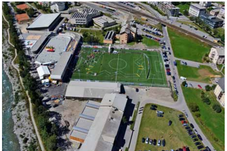
Gesamtüberblick über die Promulins Arena

Mit einem Paukenschlag wurde das neue Sport- und Freizeitzentrum Promulins Arena eröffnet. Die mit vielen Bewegungsangeboten und kulturellen Darbietungen versehene Feier bot Gästen jeden Alters etwas. Noch vor der offiziellen Er-