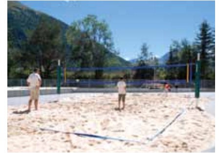
Beachvolleyball im Funsportbereich