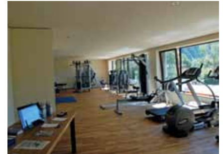
Der Kraft- und Fitnessraum der Promulins Arena