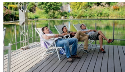
Drei Geniesser, entschädigt für viele Abende, während ihre Ehefrauen in Puoz am Proben sind.