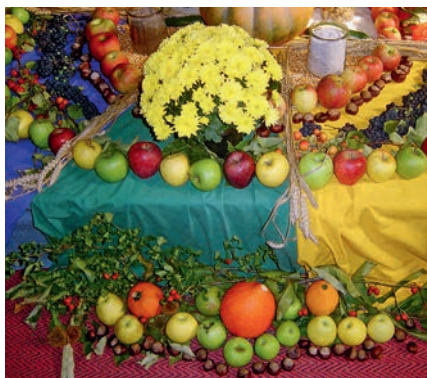
Erntedank / Festa da racolta