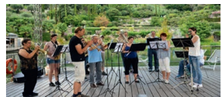
Auftritt auf der Seebühne in den Gärten von Trauttmansdorff