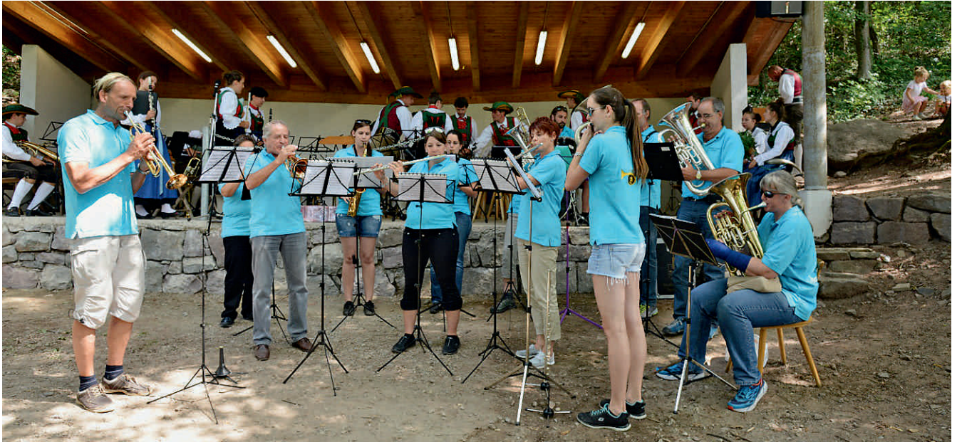
Auftritt am Musikfest in Burgstall