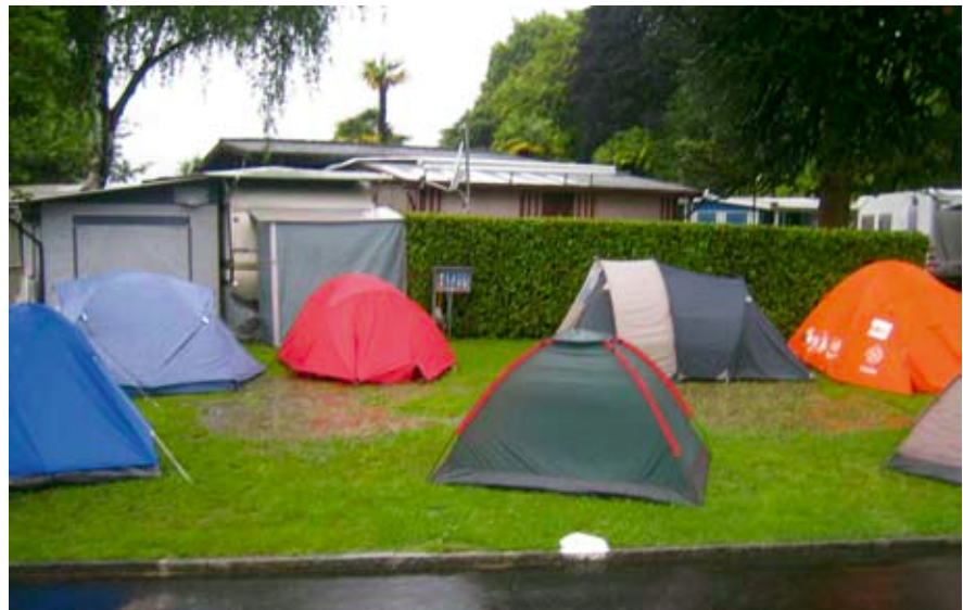
Il campeggi Miralago suot la plvgia