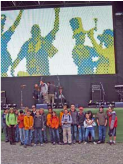
La classa sül Piazza Grande da Locarno

Mardi damaun, zieva üna inspeziun da las tendas, nun es resto displaschavelmaing ünguott'oter cu da müder il program e da turner vers saira a Samedan. Staungels e bletschs, pero cun bunas aligordanzas essans rivos inavous a Samedan.