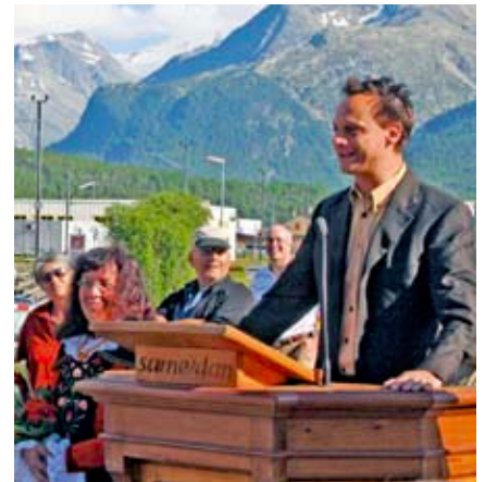
Die Innbrücke wird offiziell dem Verkehr übergeben

La punt veglia d'atschel dataiva dal 1893. Schabain rinforzeda dal 1937 e 1954, nu correspundaiv'la pü a las exigenzas dal trafic modern. Ella d'eira memma stretta e purtaiva be 22 tonnas. In meg da l'an passo è'la gnida spusteda per 19 m vers ingiò, inua ch'ella ho servieu scu provisorium fin tar l'avertüra da la punt nouva. Alura, zieva 115 ans da servezzan, è'la gnida desdrütta ed alluntaneda. L'avertüra da la punt nouva es ün ulteriur term decisiv in connex cul concept da trafic da Samedan.