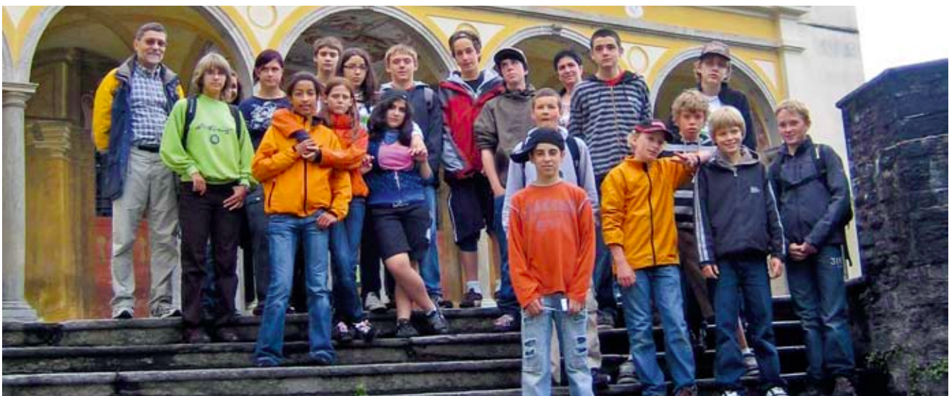
La classa davaunt la baselgia Madona del Sasso