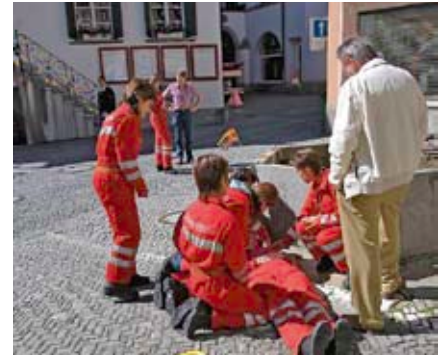
Sanitätszug erklärt eine Rettung

Seit ihrem Bestehen fördert die Gebäudeversicherung Graubünden die Feuerwehren mit Beiträgen an Ausrüstung und aufgabenorientierte Ausbildung sowie mit Führungsunterstützung im Ereignisfall. Zudem unterstützt die GVG jährlich mit 3.5 bis 5 Mio. Franken die Erstellung und den Ausbau der Wasserversorgungen durch die Gemeinden. Damit soll die Löschwasserversorgung dauernd sichergestellt bleiben. Im System von Schadenverhütung, Schadensbekämpfung und Schadenerledigung der Gebäudeversicherung Graubünden kommt der Feuerwehr eine Schlüsselrolle zu. Diese hat die Bündner Feuerwehr in den letzten Jahren mit zunehmendem Erfolg erfüllt. Die Beschleunigung der Einsätze durch bessere Alarmierung und Motorisierung, gezielte Ausbildung, Ausrüstung und organisatorische Straffungen ha-