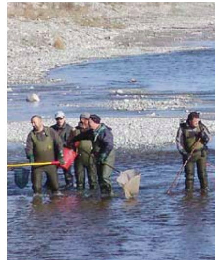
Die Mannschaft der kantonalen Fischereiaufsicht und Mitarbeiter des HYDRA-Instituts bei der alljährlichen Fischbestandsaufnahme im Inn. Seit 2001 wurden viele Tausend elektrisch gefangener Fische bestimmt, gezählt, gemessen und danach wieder zurückgesetzt.