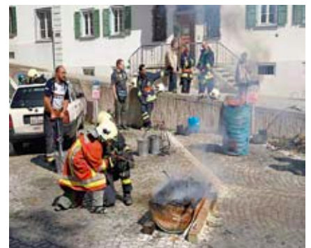
Zug 2 gibt Auskunft

ben in den letzten zehn Jahren wesentlich dazu beigetragen, dass die Brandschäden deutlich gesunken sind. Besonders bemerkenswert ist, dass diese Effizienzsteigerung trotz massiver Bestandensenkungen erzielt werden konnte. Innerhalb von zehn Jahren sind die Feuerwehrbestände von über 12000 Personen auf unter 6000 gesunken. Die Zahl der Feuerwehren wurde von 230 auf 107 reduziert.