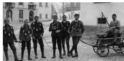
Chalandamarz 1915 vor der Chesa Planta

Die folgenden drei Aufnahmen zeigen den Chalandamarzumzug in den Jahren 1915 und 1919. Vieles erinnert uns an den heutigen Umzug, besonders die Verteilung der Chargen der Knaben. So sind die Kleider der verantwortlichen Schüler die gleichen geblieben. Was sich geändert hat, das sind die bunten Papierrosen der Marusas, welche auf den Bildern noch fehlen. Übrigens auch 1915 fehlte der Schnee fast ganz und man musste mit dem Leiterwagen die gesammelten Gaben transportieren.