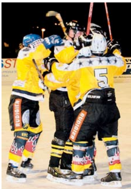
Jubelt die erste Mannschaft auch am Schluss der Saison?