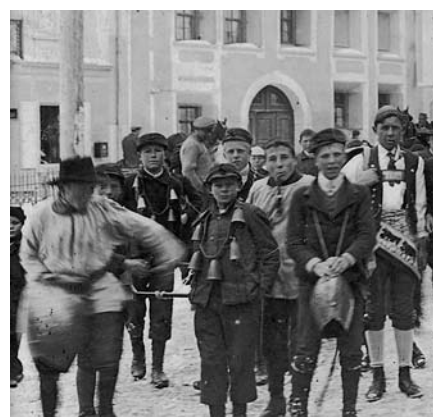
Chalandamarz 1919 Plazzin

Las trais fotografias dal Chalandamarz dals ans 1915 e 1919 ans muossan differentas vistas da Samedan dal temp vegl. In ögl daun sgür ils bels costüms dal sain, dal chaschier e dals pasters. Da l'an 1915 mauncha la naiv süin las vias tres cumün, uschè cha s'ho stuvieu piglier impe da la schlitta ün charin. Da quel temp maunchan eir las bellas rösas da las marusas da Chalandamarz.