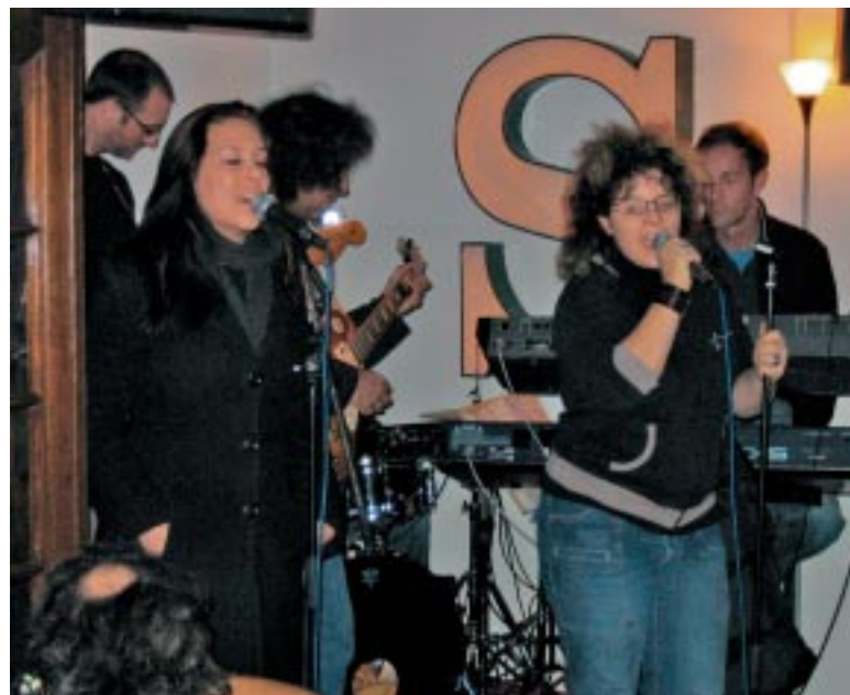
La 6 evla classa A da Samedan