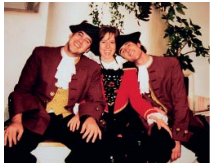
La «Bündner Herrschaftstracht» cul chapè a trais pizs

Daspö bgers ans es tradiziun, cha'ls giuvs, chi nu possedan ün dals costüms manzunos, piglian a fit la «Bündner Herrschaftstracht» cul bel chapè a trais pizs. Pel mumaint retira la Giuventüna da Samedan quists costüms tar Möller Kostümverleih a Turich.