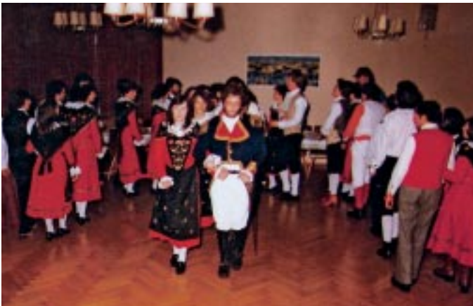
Bal da schlitteda dal 1978

Dal god da Staz davent as muvainta la schlitteda vers l'hotel Sonne a San Murezzan. Davaunt la baselgia catolica vain alura fatta la stüerta per ir giò sül lej da San Murezzan. Lo passainsa speravi la high society in pelissa, chi gioda il schampagner e bütt'our ils raps a las famusas cuorsas da chavals. Zieva avoir traverso tuot il lej, giainsa sül Hotel Waldhaus. Lo fainsa nossa posa da gianter ed eir noss chavals as paun recreer da la lavur prasteda.