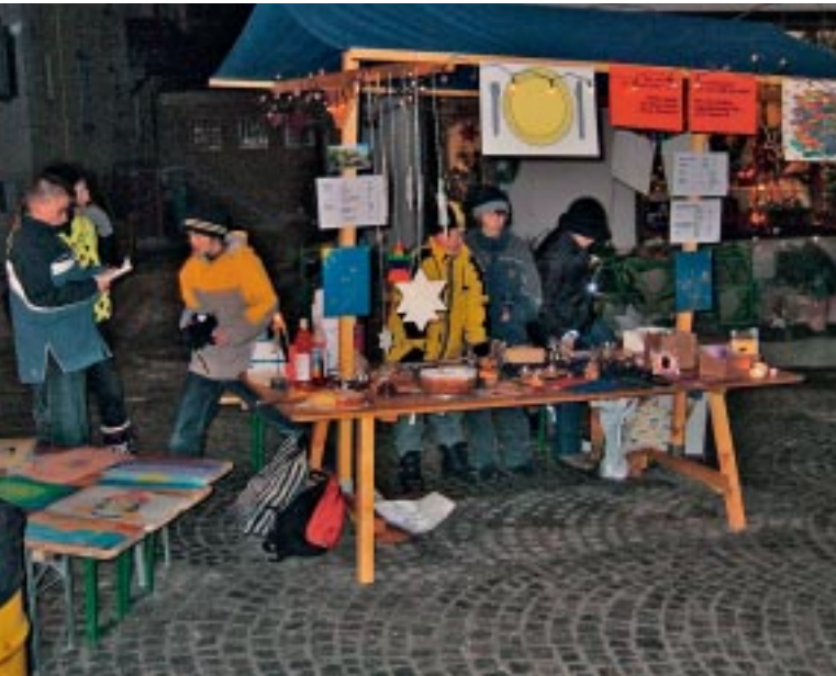
GRAZCHA FICH a tuot quels e quellas, chi haun cumpro qualchosa tar nus.

Ûn di aunz il marchò d'eiran tuots ün pô agitos, nus ans vains allegros/-edas fichun da vender nossa roba. La magistra vaiva dit, cha que füss bun, scha nus tressans aint Moonboots. Ma ella es steda l'unica cun Moonboots! Da vender es sto fich bel, ma ün pô fraid.