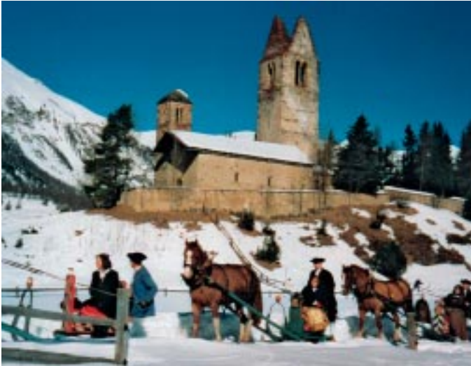
Schlitteda dal 2003 tar San Gian

tuots sun pronts, do el alura il segn da partenza. Cun güvels as metta la serp da schlittas plaunet in muvimaint. La ruta ans maina aint per la Via da las Gennas fin aint a Punt Muragl. Lo passainsa suravi la rundella e'ns instradains vers San Gian. Già düraunt quist prüm traiget badainsa, cha las bunuras in Engiadina paun esser magari fraidas e mincha giuvna, chi ho piglio cun se üna cuverta, es furtüna da's pudair paquetter aint. Ils giuven haun oramai da tgnair dür e da tegner ils frandavels.