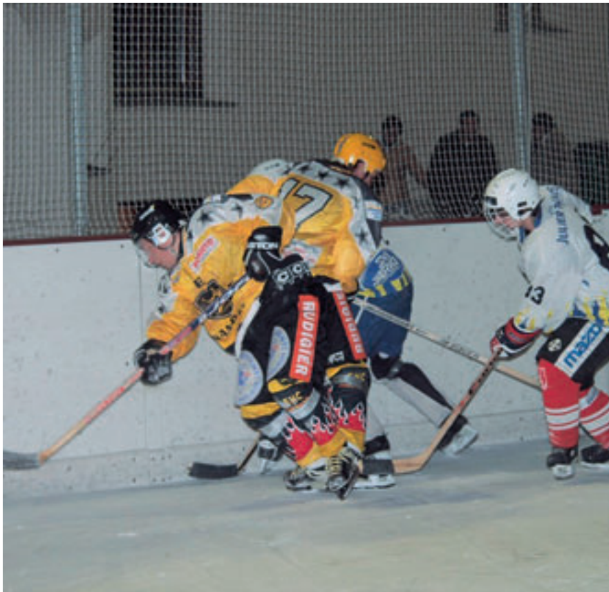
Silvaplana gegen Samedan beinahe gestrauchelt