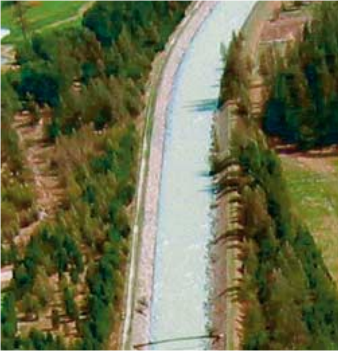
Der Flaz vegl hat seine Gestalt verändert vorher