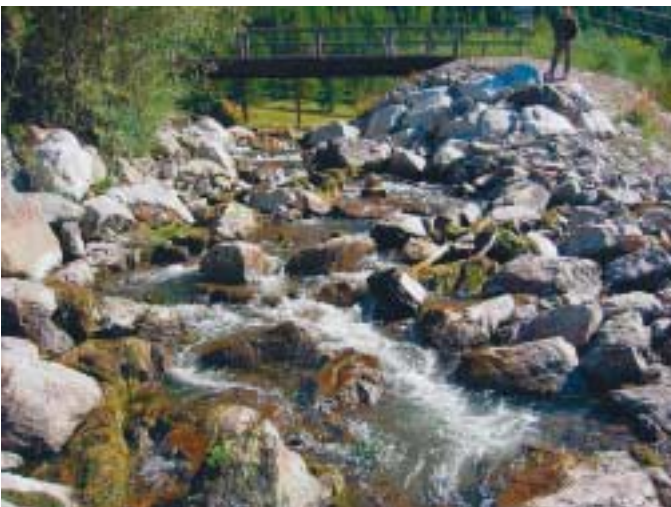
Auslauf Gravatscha. Die aufgelöste Steinrampe ermöglicht die freie Fischwanderung.