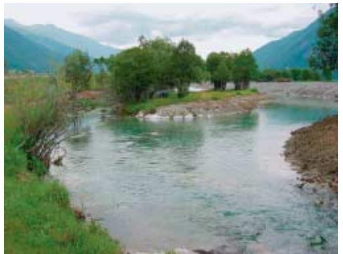
Zusammenlegung En und Altlauf. Bald kann der En in sein altes Bett zurück.

Aus einem ausgedienten Kanal soll ein naturnaher Bach entstehen. Das war die Aufgabe, die an uns gestellt und die nicht immer leicht zu erfüllen war. Die Gestaltung des Flaz vegl ist heute bis auf den untersten Bereich der alten Mündung beinahe fertig. Der zukünftige Wander-