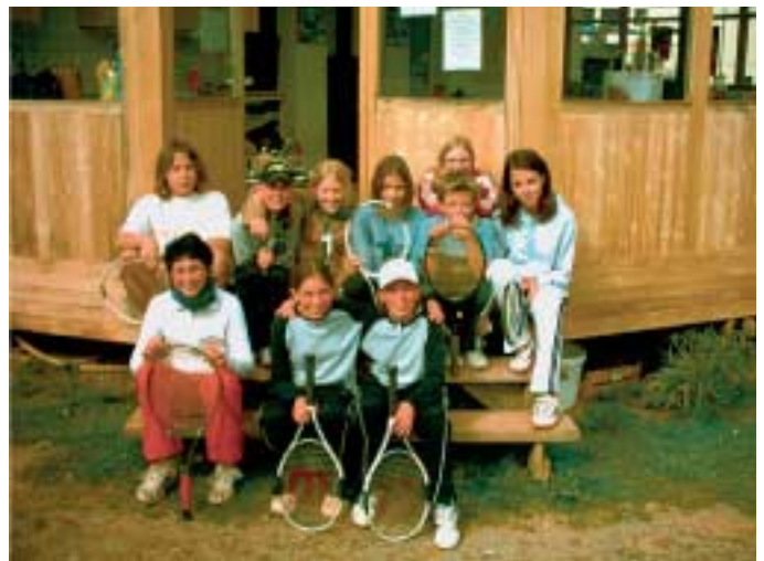
Die gutgelaunten Teilnehmer/innen des Schülerturniers