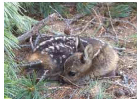
Der kleine „Star“ des Tages

Ein grosses Dankeschön gebührt allen Mitgliedern der teilgenommenen Vereine, dem Forstamt Pontresina/Samedan und dem Werkdienst der Gemeinde Samedan.